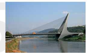
Mariánský most v Ústí nad Labem