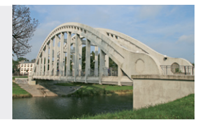
Železobetonový most v Karviné-Darkově