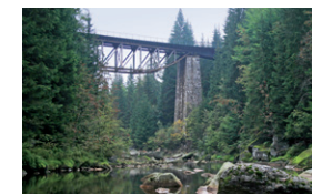
Jizerský most na trati Tanvald-Harrachov