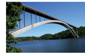
Žďákovský obloukový most