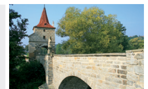
Renesanční most ve Stříbře