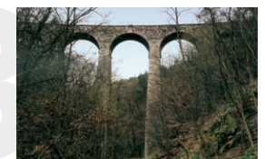
Železniční most v Žampachu