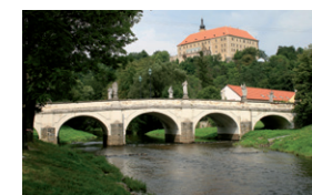
Barokní most v Náměšti nad Oslavou