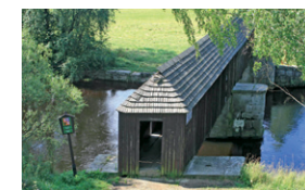
Dřevěný most v Lenoře