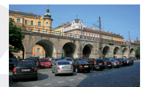
Negrelliho viadukt v Praze