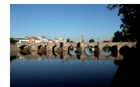
Gotický most v Písku

Všechny mince cyklu „Mosty České republiky“ jsou vyrobeny ze zlata o ryzosti 999.9. Jejich hmotnost činí 1/2 trojské unce, tj. 15,55 gramů, a jejich průměr je 28 mm. Mince se vydávají ve dvojím provedení ražby – v běžné kvalitě, u které je celá plocha mince stejně leštěna, a ve špičkové kvalitě s leštěným mincovním polem a matovaným reliéfem.